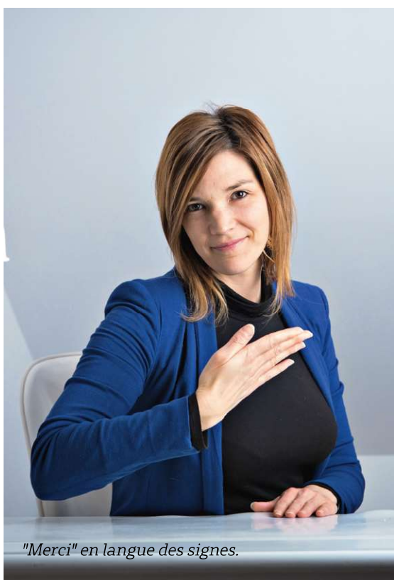
"Merci" en langue des signes.