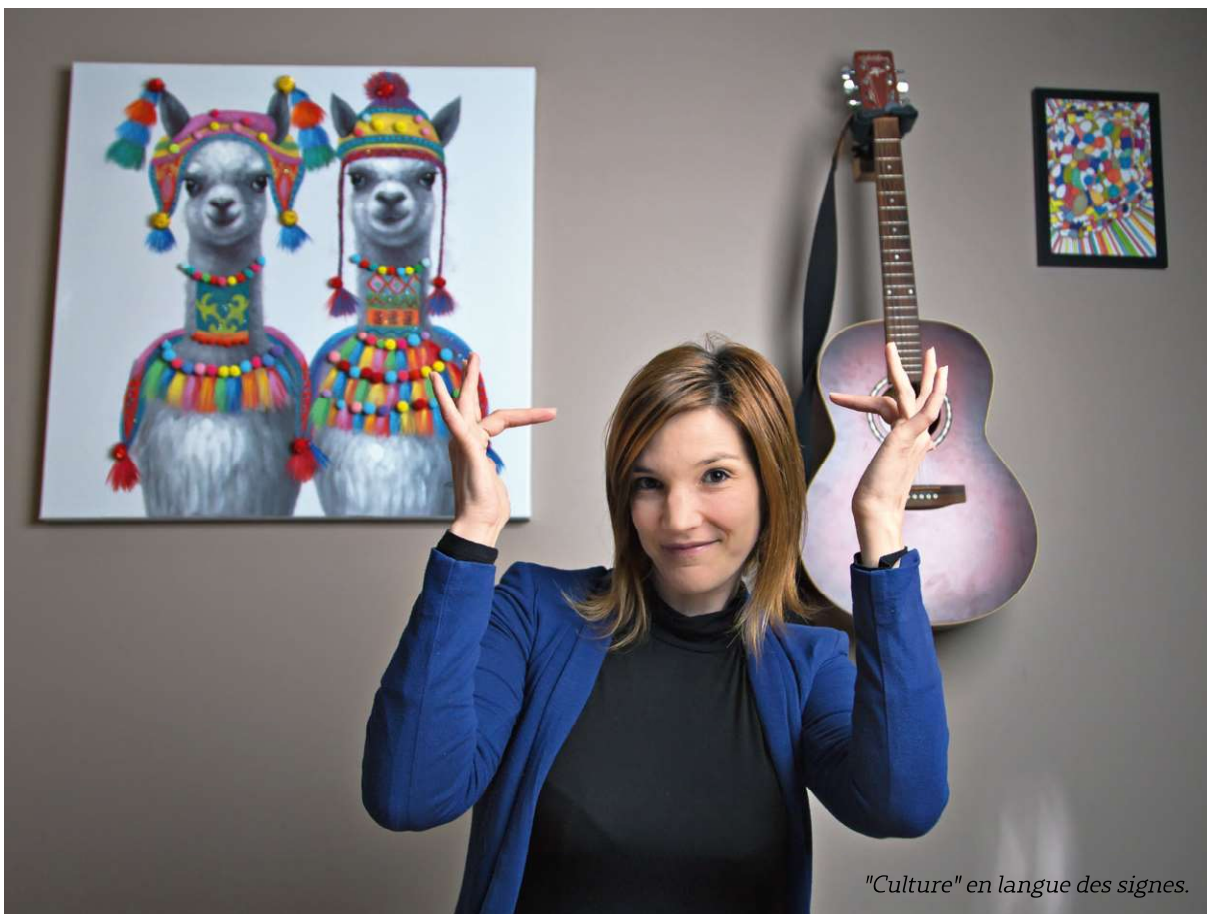
"Culture" en langue des signes.